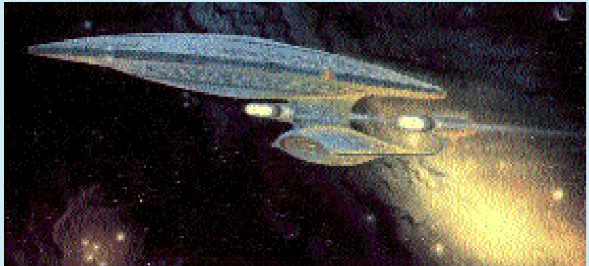
Antigravitations-Antrieb aus der Filmserie "Startrek": so könnte die Raumfahrt-Technik mit Antigravitation und RQM-Impulstechnik der Zukunft aussehen.

pelt werden kann. Das entspricht einer Leistung von 0.040 bis 0.400 kW oder mehr pro 1cm 3 Leistungszone. Die Wirkung des Deuteriums ist katalytisch, kein Verbrauch, keine Abnutzung, keine Verschmutzung wie bei der Brennstoffzelle. Möglich wird diese neue Entwicklung durch die Nanotechnologie, mit der solche mikroskopischen Schieber realisiert werden können, d.h. die Raum-Quanten-Energie wird im Nanobereich angezapft. Diese neue Technologie zeigt den Weg aus der nuklearen und fossilen Sackgasse. Obwohl heute noch ein winziger Effekt - dies war nicht anders bei der Entdeckung der Kernspaltung durch Hahn & Strassmann -, hat die Kernresonanzkopplung das Potenzial, die Kernspaltung zu ersetzen.