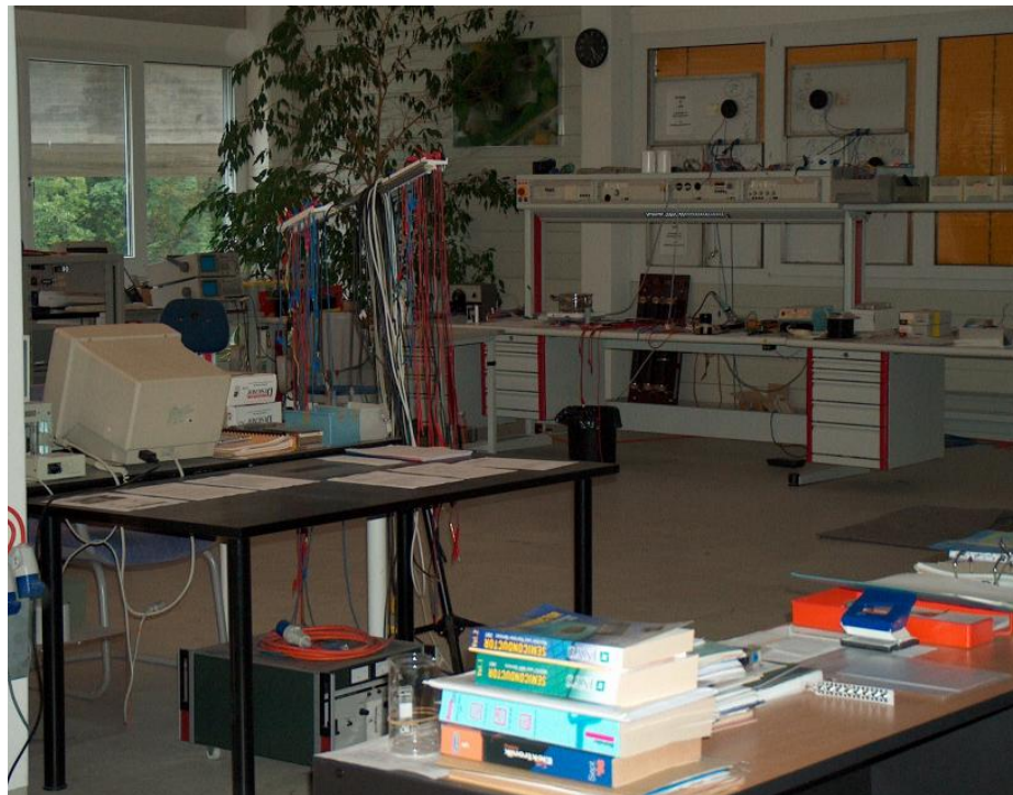
Blick ins RQF-Labor.

JL: Ja, ganz bestimmt. Die totale Sonnenfinsternis am 11.8.1999 in Europa und anschliessend in der Türkei löste am 17.8.1999 in der Nähe von Istanbul ein Erdbeben mit der Magnitude 7.8 aus. Wissenschaftliche Berichte in "Science" zirka 6 Monate nach diesem Ereignis berichteten von Satelliten-Messungen der Erdkruste in der Erdbeben-Region. Die Erdkruste wurde im und während der Dauer des Kernschattens um 12 Meter angehoben, anschliessend wieder um 12 Meter abgesenkt. Das musste zwangsläufig gewaltige Spannungen in der Erdkruste hervorrufen. Die heute nachweisbaren Neutrinos haben nicht die Energie, solche Veränderungen hervorzurufen. Dazu sind nur die mechanischen Energien der 5. Grundkraft in der Lage.